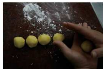
6. 手工成型成圓球形，光滑。