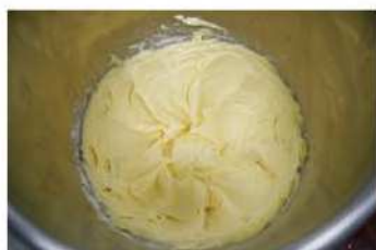
1. 將奶油、糖粉(過篩)打發。