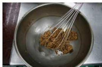
1. 黑糖、細砂糖、奶油拌勻。