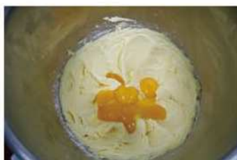
2. 蛋黃加入充分打發拌勻。