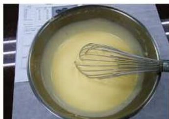
1. 全部材料拌勻，無粒狀。