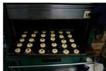
9. 爐溫 200/180℃烤約15分鐘。