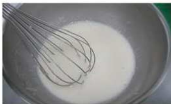
5. 麵糊發酵(28°C) 2-3小時。