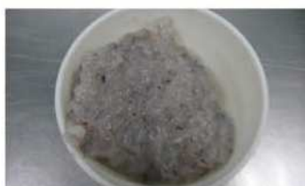
2. 草蝦仁去腸泥、洗淨、拍碎。