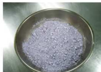
3. 加入粉料，用手搓成細粉狀。