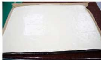
4. 麵糊表面刮平成平均厚度。