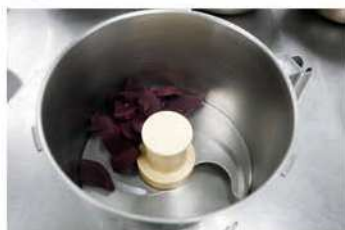
1. 紫山藥及紫地瓜→蒸熟攪泥。