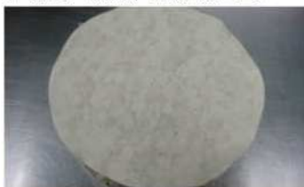
8. 蓋上另一張春捲皮壓平整。