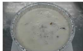
8. 剩餘麵糊1/2量，大火蒸熟。