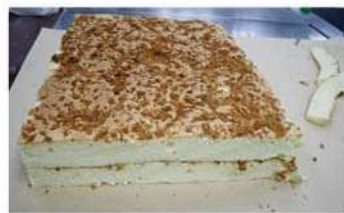
9. 冷卻後以沙拉醬夾心。