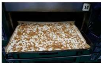
8. 烤溫200 / 170℃，30分鐘。