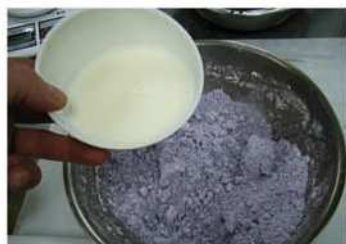
4. 牛奶分次加入，用手搓勻。