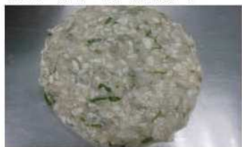
7. 春捲皮抹入內餡，抹平。