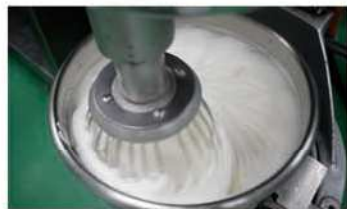
4. 蛋白、塔塔粉、糖打發。