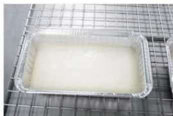
7. 蒸熟透之椰漿糕，大火蒸熟透。