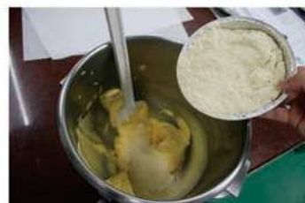
3. 杏仁粉加入攪拌均勻。