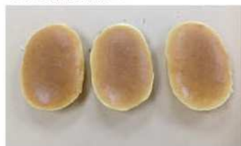
9. 產品脫模、冷卻、裝飾。