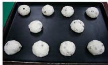
6. 麵糰分割，滾圓、鬆馳。