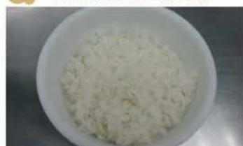
1. 將米洗淨泡水、加水蒸熟。