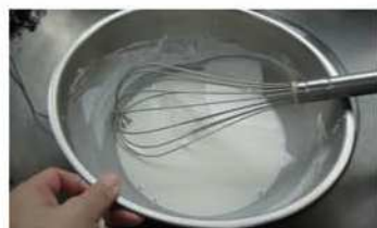
1. 米粉、水於鋼盆中，攪拌均勻。