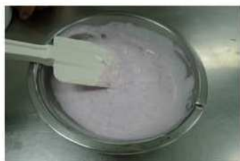
4. 紫麵糊，鬆弛30分鐘，備用。