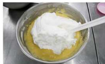
3. 蛋白糖與麵糊拌勻。