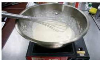
2. 米穀粉、奶水一起糊化。