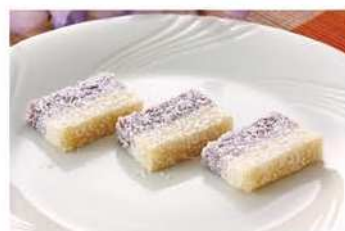
9. 冷卻，外表沾椰子粉。