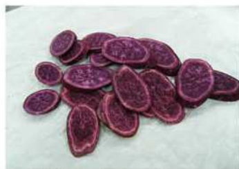
1. 紫薯去皮、切片、蒸熟。