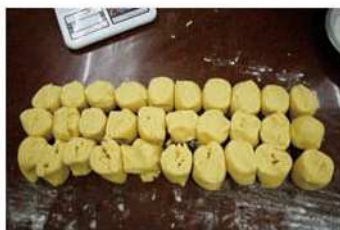
5. 將麵糰搓長切斷，分塊。