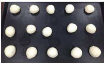
5. 麵糰分割，滾圓、鬆馳。