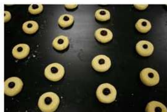
7. 中央置放半顆蜜餞櫻桃。