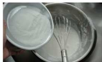
3. 將糖加入拌勻溶解，降溫。