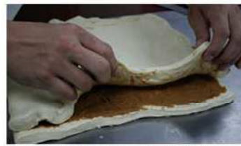
6. 中央夾榛子醬，切條螺盤捲。