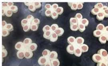
7. 整型 - 中切4刀盤捲。