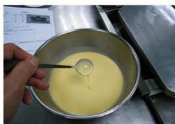
4. 麵糊使用前，需輕拌無沈澱。