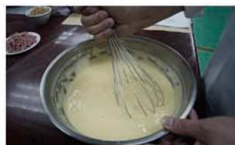
3. 米穀粉過篩加入拌成麵糊。