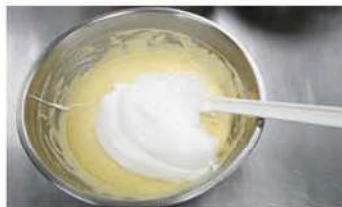
5. 蛋白糖與乳酪麵糊拌勻。