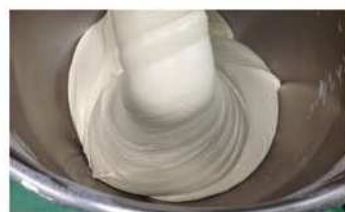
3. 主麵糰原料攪拌至麵糰光滑。