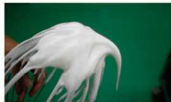
4. 蛋白糖打發至濕性發泡。