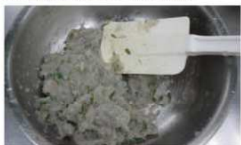
4. 鹽、雞粉、糖、澱粉拌勻。