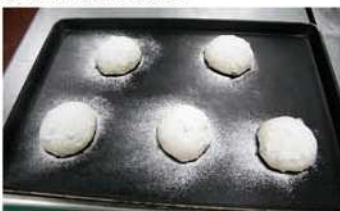
8. 麵糰表面灑粉-切十字形。