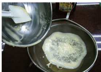
2. 麵糊過篩，靜置30分鐘。