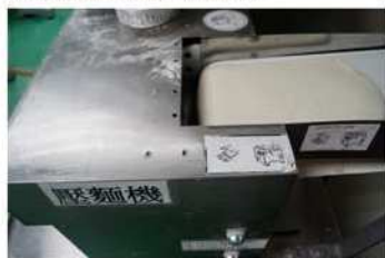
4. 用麵壓機將糰壓至麵帶光滑。