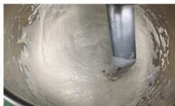
1. 中種麵糰攪拌均勻。