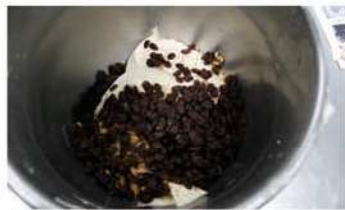
4. 加入葡萄乾、核桃拌勻。