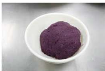
2. 紫地瓜和紫山藥泥。