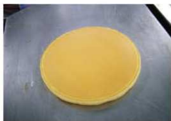
7. 煎至底部金黃色後翻面。