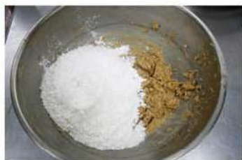
4. 米穀粉、低粉過篩加入拌勻。