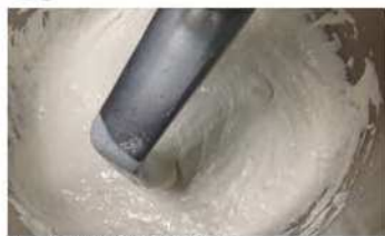
1. 中種麵糰攪拌均勻。