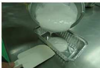
5. 蒸盤噴油，舀入白色椰米漿。