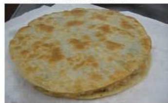
9. 蝦仁糰雙面油炸至金黃色。