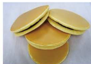
9. 表面使用烙鐵烙印。