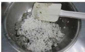
5. 肥肉、馬蹄，熟飯調拌均勻。