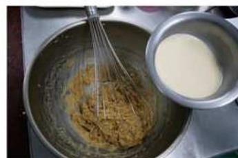
3. 奶水分次加入拌勻。