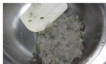
3. 蝦仁手捏至會黏手。