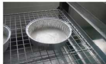
6. 米糊1/2量倒入蒸盤，大火蒸。