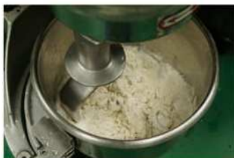
2. 麵糰攪拌成糰-發酵。