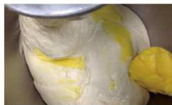
3. 主麵糰原料攪拌至麵糰光滑。