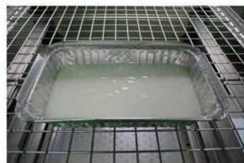
6. 大火蒸熟透，約15分鐘。