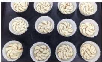
7. 整型後排列於烤盤中。