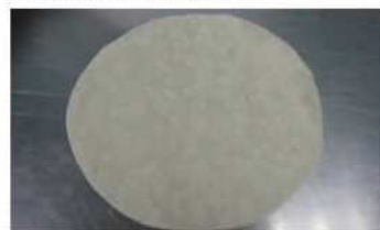
6. 春捲皮攤開，擀平兩片。