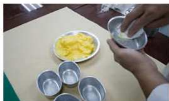
1. 將海綿模型邊緣塗油備用。