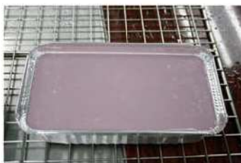
8. 再舀入紫山藥熟透。