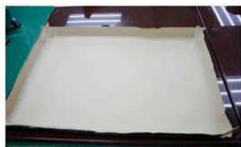
1. 準備烤盤，表面墊牛皮紙。