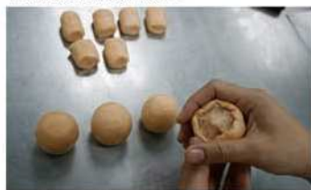
7. 麵片包櫻花餡-半球形。