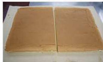
6. 產品出爐冷卻後對切。