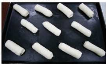
7. 整型後排列於烤盤中。