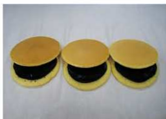
8. 二片中央夾紅豆沙餡。