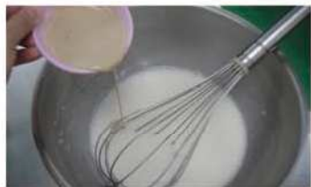
4. 酵母加水溶解，加入米糊中。