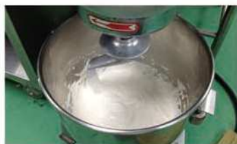
1. 中種麵糰攪拌均勻。