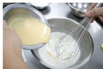
3. 白麵糊，鬆弛30分鐘，備用。