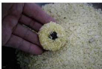
8. 表面刷蛋黃、沾杏仁碎片。