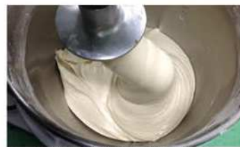
3. 主麵糰原料攪拌至麵糰光滑。