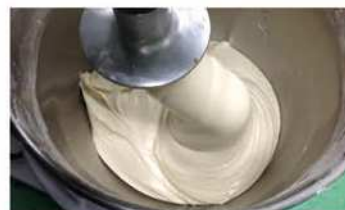
3. 主麵糰原料攪拌至麵糰光滑。