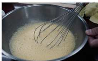
2. 奶水、奶油、鹽，蛋黃拌勻。