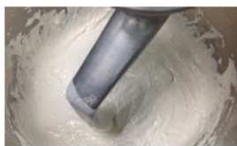
1. 中種麵糰攪拌均勻。