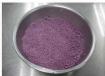
5. 用手搓鬆散，過篩成散粒狀。