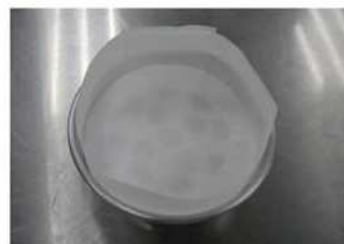
6. 鬆糕模具內抹油或墊紙。