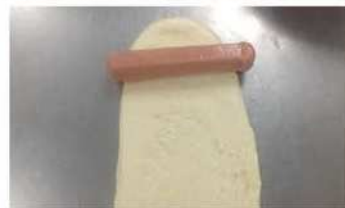
6. 麵糰擀開、中央夾熱狗。