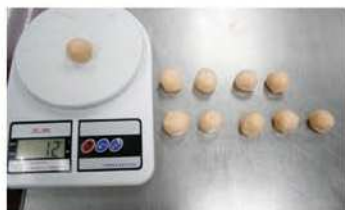
1. 櫻花蝦油皮製作-分割。