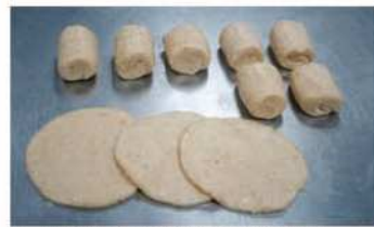
6. 將麵糰擀開10cm-麵片鬆弛。