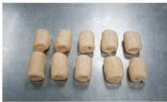
5. 油皮包油酥擀摺二次，鬆弛。