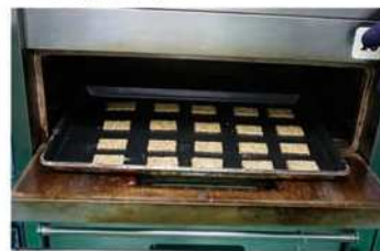
9. 爐溫 200/170°C烤約20分鐘。