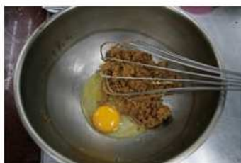
2. 蛋黃加入充分打發。