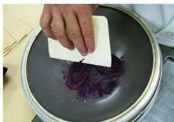
2. 將蒸熟紫薯、壓泥，過篩。