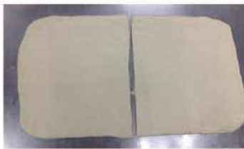
5. 麵糰壓平滑，分成兩片。