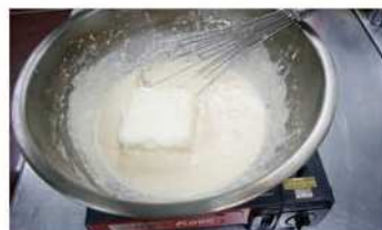
3. 軟質乳酪麵糊熬煮。