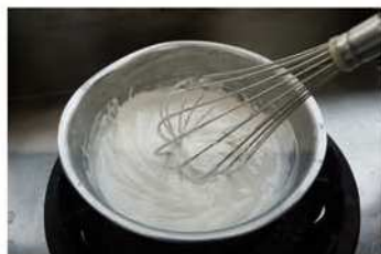
1. 米穀粉發酵甜酒釀米。