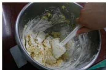
4. 低粉(過篩)加入輕輕拌勻成糰。