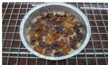
7. 白糖糕取出，中央放泡酒桂圓。