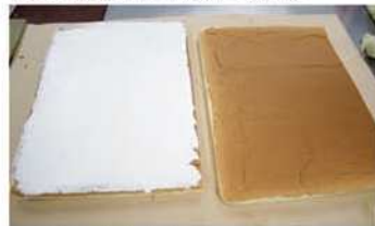
7. 蛋糕中央夾鮮奶油。