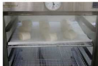
9. 使用中火蒸約5分鐘。