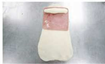
6. 中央夾乳酪，切7刀盤捲。