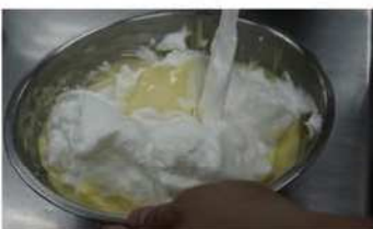
5. 蛋白糖與麵糊拌勻。