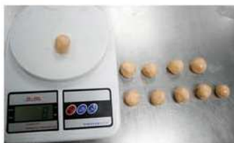
2. 櫻花蝦油酥製作-分割。