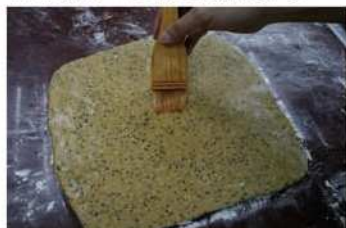
7. 表面刷蛋水，灑白芝麻。