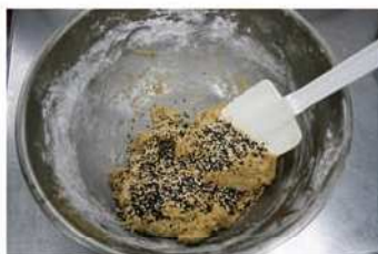
5. 熟黑芝麻加入拌勻。