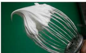
2. 蛋白糖攪拌至乾性發泡。