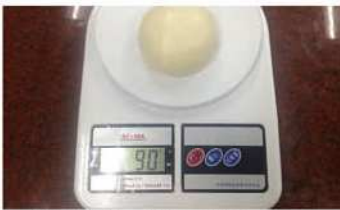
5. 麵糰分割，滾圓、鬆馳。