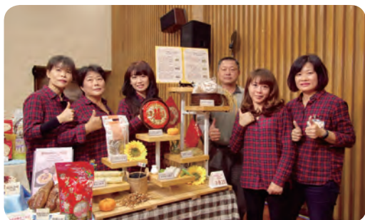
▲ 冠軍隊伍：鹿草鄉農會