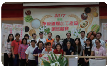
▲ 北區複賽入圍決賽隊伍與農糧署長官、評審合影留念。