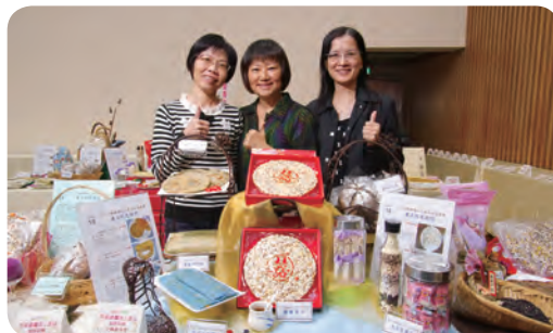
▲ 優勝隊伍：水上鄉農會