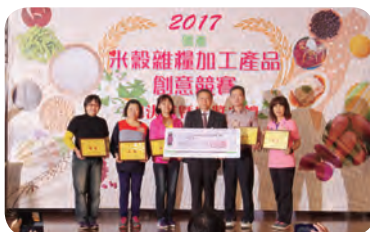
▲ 總決賽優勝隊伍選手與陳建斌署長合影。