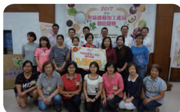
▲ 南區複賽入圍決賽隊伍與農糧署長官、評審合影留念。