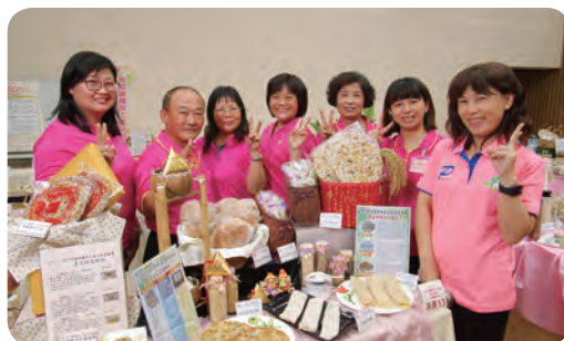
▲ 優勝隊伍：竹塘鄉農會