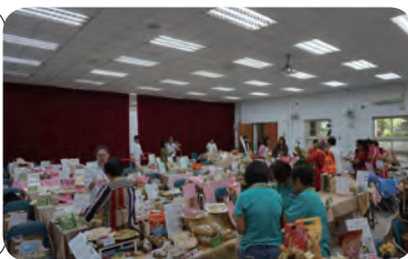
▲ 南區複賽選手作品擺設實況。