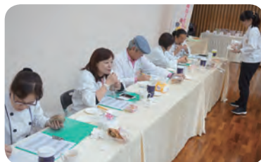
▲ 全國總決賽評審實況。