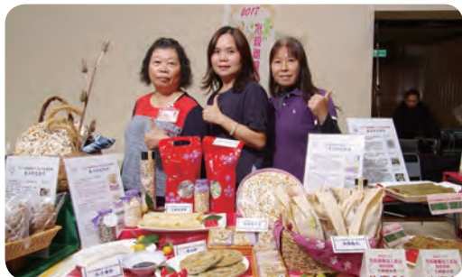
▲ 優勝隊伍：大園區農會