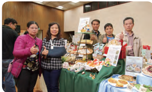
▲ 優勝隊伍：清水區農會