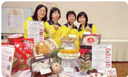
▲ 季軍隊伍：花壇鄉農會