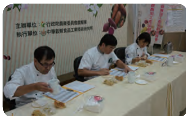
▲ 南北區複賽評審實況。