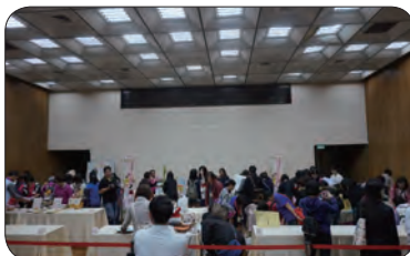
▲ 全國總決賽選手作品擺設實況。