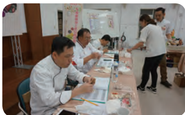
▲ 南區複賽評審實況。