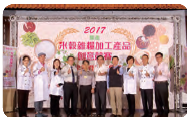
▲ 全國總決賽農糧署長官、穀研所長官與評審合影。