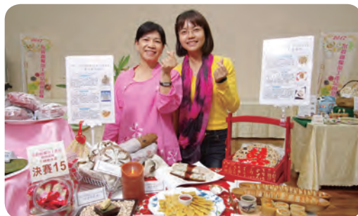
▲ 優勝隊伍：水里鄉農會