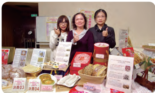
▲ 亞軍隊伍：苗栗市農會