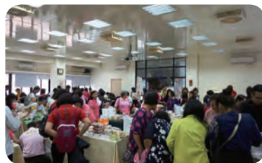
▲ 北區複賽選手作品擺設實況。